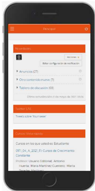
Out of the box