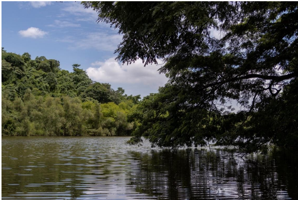
Fotografía del lago del bosque Protector