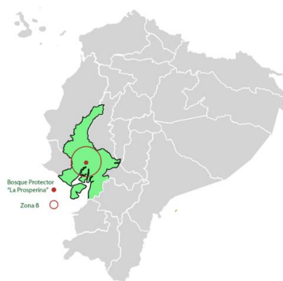
Mapa de zona 8 de Guayaquil. Elaboración del Autor