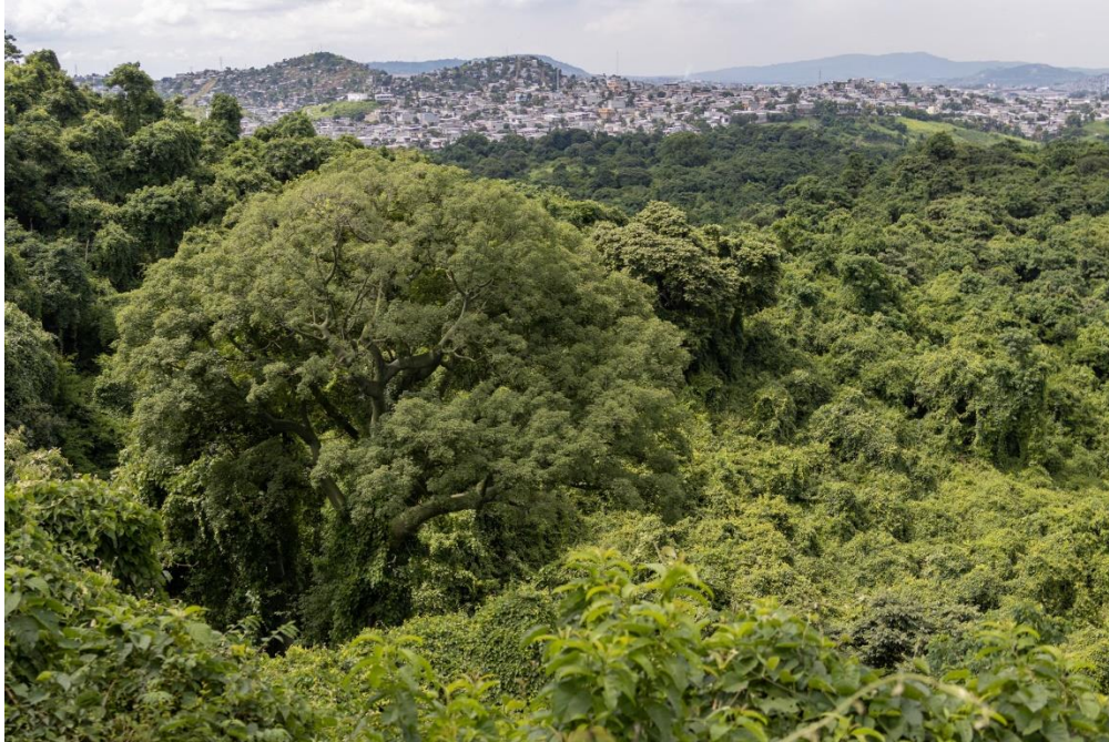
Fotografía en época de invierno en el bosque protector.